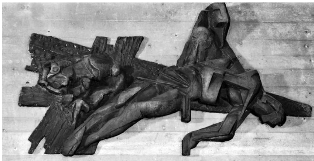
Carmen Silvestroni, XIV Stazione della Via Crucis , vetroresina, 1980, Forlì, Chiesa di Regina Pacis

ritano induce all'aiuto sul posto di lavoro spesso privo dell'umanità di Cristo offerta sulla croce.