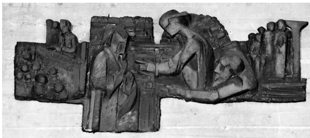
Carmen Silvestroni, VI Stazione della Via Crucis , vetroresina, 1980, Forlì, Chiesa di Regina Pacis

Nella seconda stazione il "segno di contraddizione" (Lc 2, 34) pronunciato da Simeone è accompagnato dalla raffigurazione della scuola, che nel suo insegnamento laico non contempla l'aspetto religioso nel suo orizzonte di significato. Nella terza stazione sulla tavola dell'ultima cena ci sono i segni della guerra: un mitra, il cappello vietnamita e la rappresentazione dei soldati intenti a bere. È il richiamo alla guerra in Vietnam, sterminio per tanti uomini. La cena del Signore è il sacrificio per tutti, per portare la pace a tutti (foto 41).