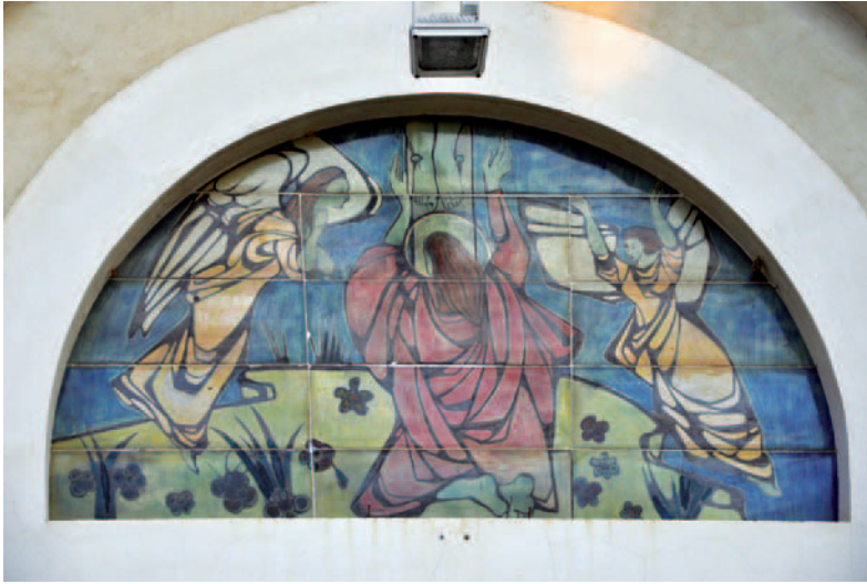
37. Leandro Lega, Santa Maria Maddalena , ceramica, Forlì, Chiesa di Villagrappa