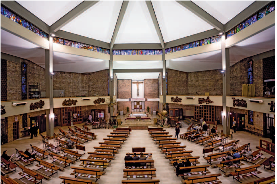
L'interno di Regina Pacis