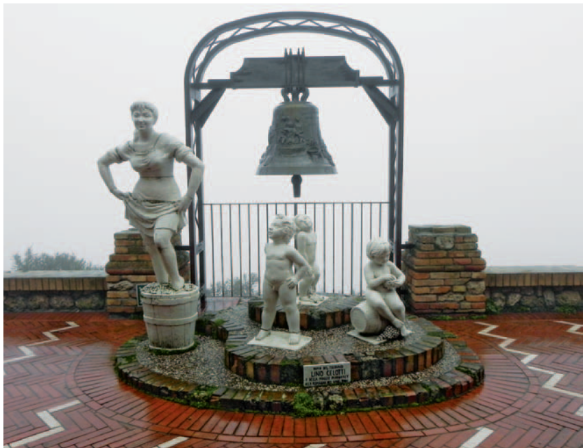
32. Gaetano Dal Monte, La bella romagnola con i tre pargoli , ceramica, 1980, Bertinoro, Cà de Bé