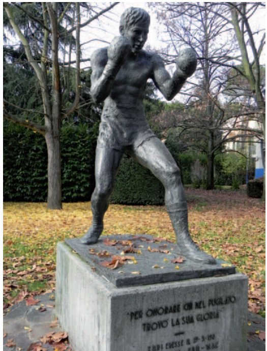
36. Giannatono Bucci, Monumento al pugile , anni '80, Forlì, Parco della Resistenza