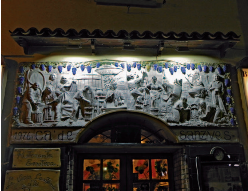
31. Gaetano Dal Monte, Omaggio alla viticoltura , 1976, ceramica, Predappio Alta, Casa del Sangiovese