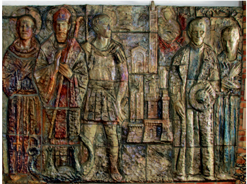
34. Giannantonio Bucci e Leandro Lega, Cappella dei Santi , ceramica, 1982, Forlì, Chiesa di Regina Pacis