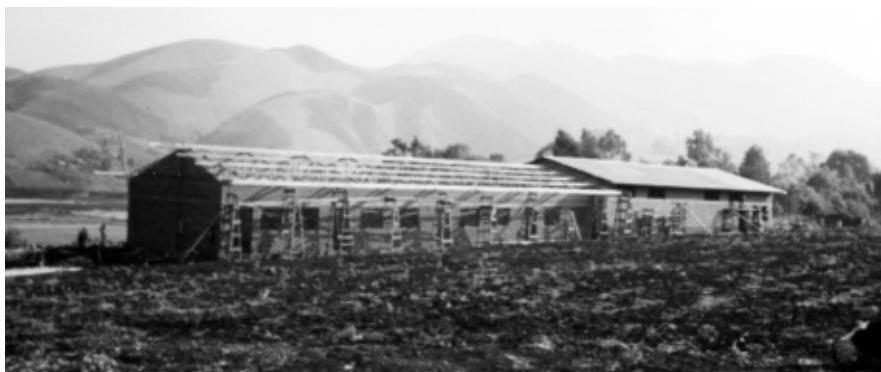
Kaniola 1993, costruzione della scuola di falegnameria

“il popolo dello Zaire è immerso in una povertà indescrivibile, soffocato da un clima infernale di violenza organizzata, proposta o tollerata dai dirigenti e dai poteri pubblici. I Vescovi zairesi invitano le autorità a gesti concreti per migliorare la situazione e domandano alla popolazione di restare vigilante e di non lasciarsi andare all’odio, alla divisione e alla violenza fraticida, ma di vivere in un clima di solidarietà” .